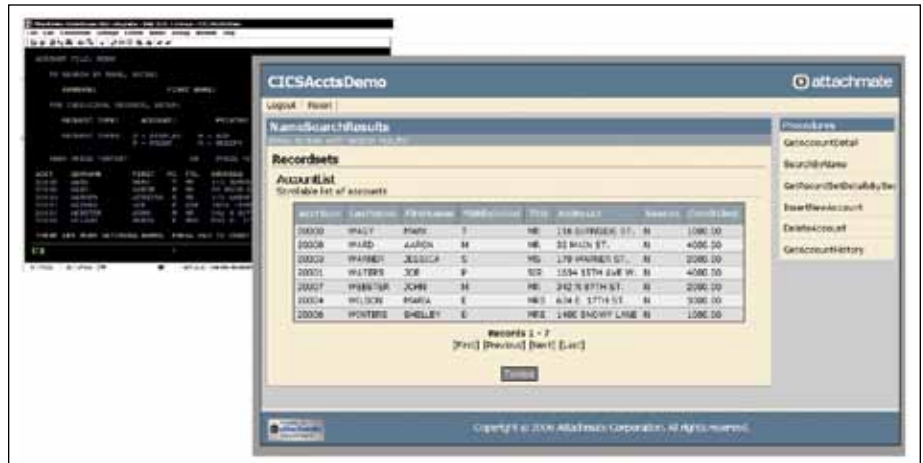
O Verastream provê capacitação web simples e controlável dos seus aplicativos legados.

— Joe Kelly, Gerente de Integração, Universal Health Services